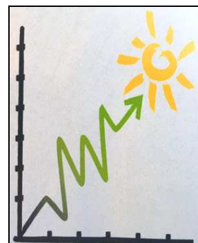
Embellie pour 2019

Au cours de l'année écoulée, pas moins de 350 personnes ont franchi la porte de nos archives, habitués ou visiteurs occasionnels, ceci en dehors de la traditionnelle journée portes ouvertes et des visites effectuées à l'extérieur. Cela fait une moyenne de 29 visiteurs par mois, répartis sur deux jours d'ouverture hebdomadaire, raison pour laquelle nous avons décidé d'ouvrir également le lundi matin dès le début de l'année 2019.