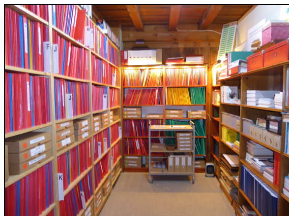
Vue partielle des archives de la Fondation

Pour la première fois en quinze ans d'existence, notre Fondation a terminé l'année avec un excédent de recettes dû à quelques dons extraordinaires. Nous allons pouvoir faire l'acquisition de quelques nouveaux éléments de bibliothèque et entreprendre le classement systématique de nos ouvrages.