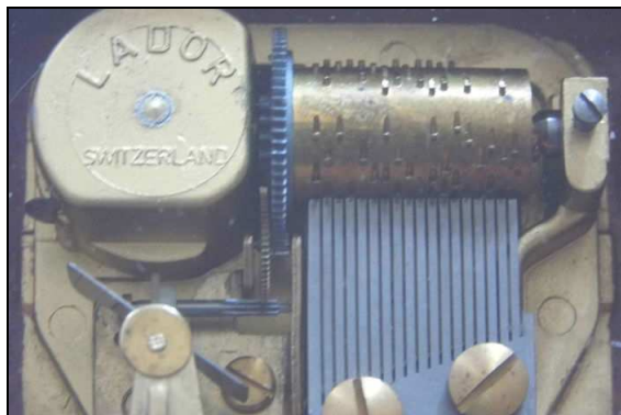
Boîte à musique Lador

Mon plus grand plaisir était d'aller rôder dans les ateliers, toujours gentiment reçu par chacun de ces nombreux ouvriers qui m'initiaient au maniement de leurs machines.