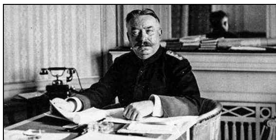
Ulrich Wille ( 1848-1925)